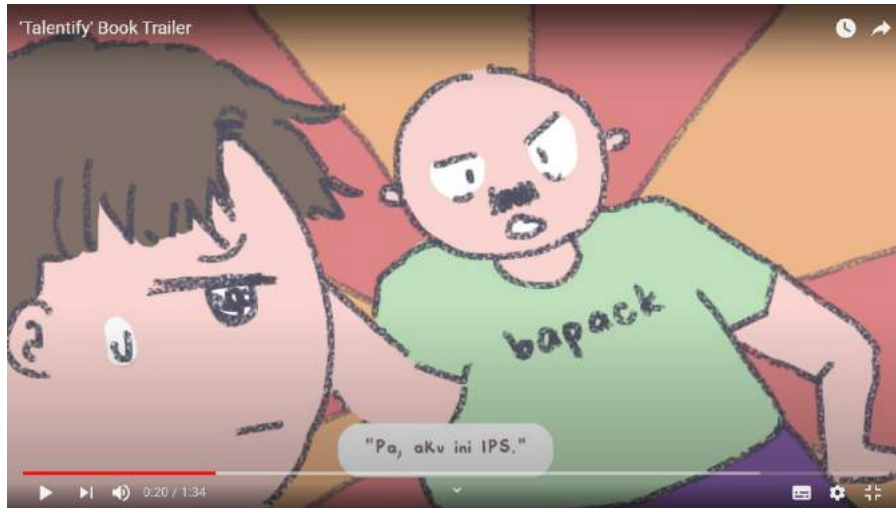
Gambar 6 Trailer Talenty