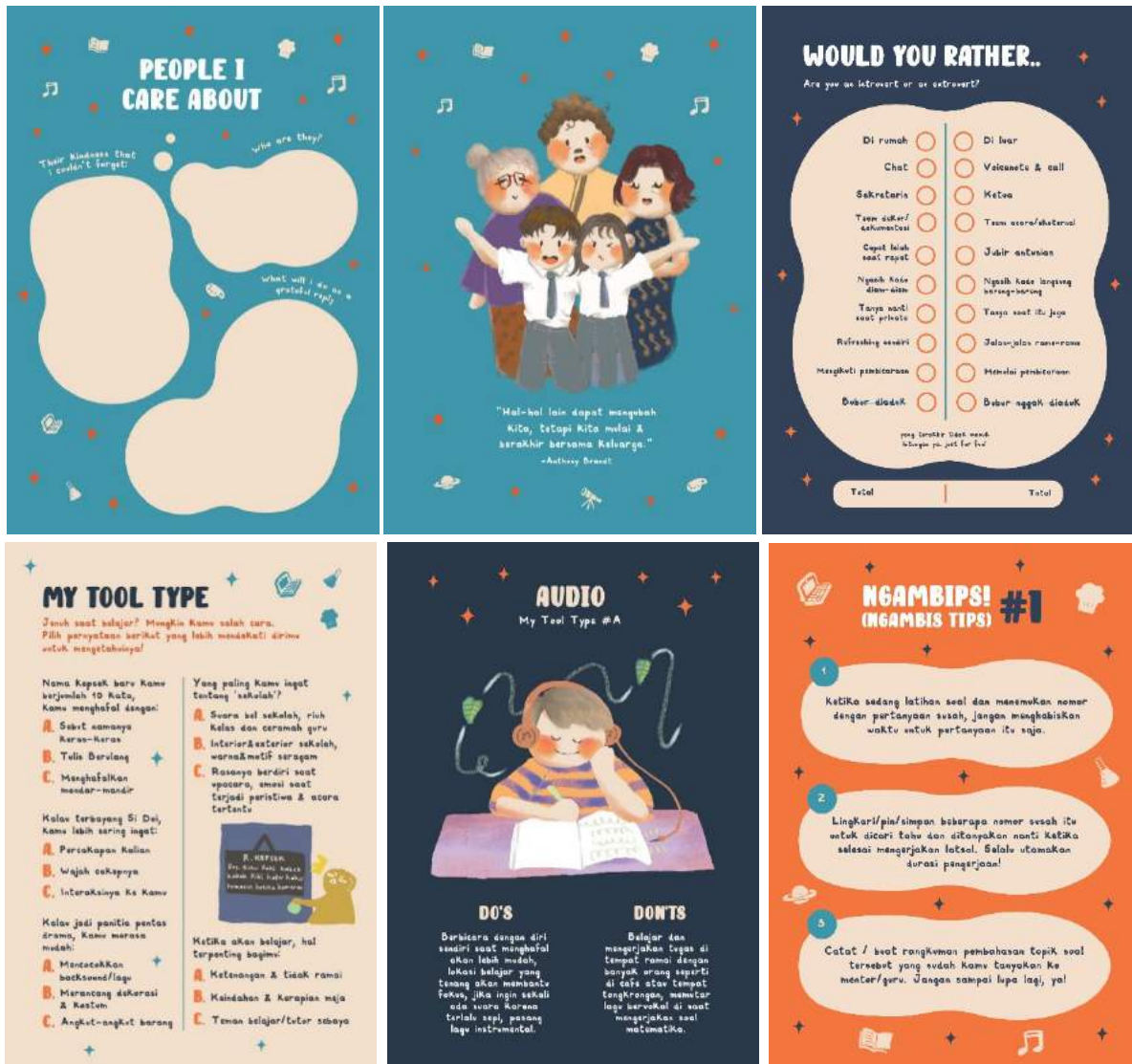
Gambar 5 Buku Aktivitas Talentify

bentuk konsistensi visual identitas brand .