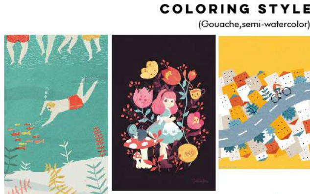
Gambar 2 Moodboard Buku Aktivitas Talentify