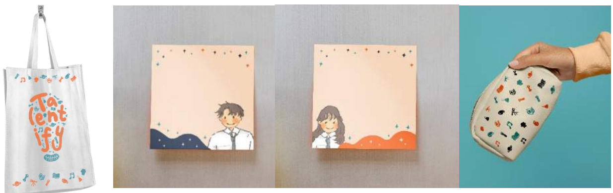
Gambar 7 Merchandise Talenty

Pengaplikasian gaya desain flat design untuk elemen grafis juga ada pada merchandise seperti catatan tempel, tas tenteng, dan kotak pensil. Ilustrasi juga menggunakan kuas gouache yang diadaptasi dari gaya desain art deco .