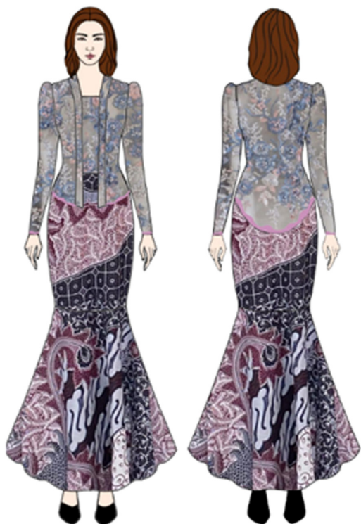
Gambar 9. Hasil jadi kebaya kutu baru