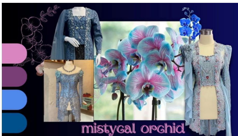
Gambar 2. Moodboard

Define Tahap kedua define yang merupakan tahap penentuan sumber ide yang akan dipilih dari pengumpulan informasi dan data yang telah dikumpulkan di tahap discover. Setelah memahami informasi yang telah didapat. penetapan bunga anggrek biru sebagai sumber ide selanjutnya yaitu dengan pembuatan moodboard. Moodboard yang berisi gambar, warna, Pemilihan kain yang sesuai dengan konsep busana. Pemilihan palet warna yang sesuai, dan menentukan aplikasi payet hiasan yang akan digunakan.