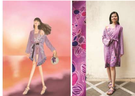
Figur 9. Daritri Dharma set Technical drawing, design, foto produk