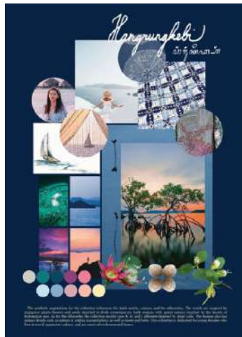
Figur 5. Moodboard & illustration Hangrungebi