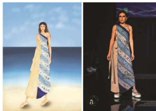
Figur 7. Tirta Paramananda dress Technical drawing, design, foto produk