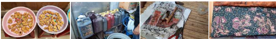
Figur 4. Dokumentasi hasil observasi.

Dilakukan melalui Google Forms , mencari tahu tentang elemen design , preferensi warna, preferensi detil pakaian, preferensi motif, dan buying behaviour konsumen.