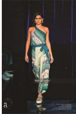
Figur 6. Kusuma Waradhana Set Technical drawing, design, foto produk