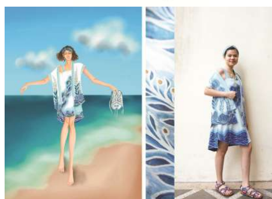
Figur 8. Sagara Eila set Technical drawing, design, foto produk