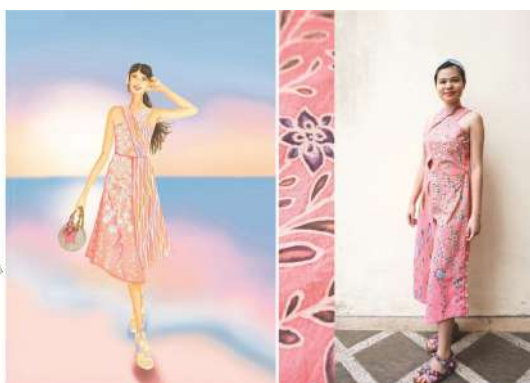
Figur 10. Kala Dhira jumpsuit Technical drawing, design, foto produk