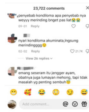
Gambar 3. Komentar penonton pada Konten Video

Contoh dari respon audiens bisa dilihat dari gambar diatas, terlihat bahwa terdapat beberapa komen dengan respons yang berbeda. Komen pertama bahwa audiens bertanya-tanya apakah penyebab dari penyakit itu lalu saat sudah menemukan informasinya langsung merinding saat melihat gambarnya. Komen kedua terlihat bahwa di komen tersebut langsung dikatakan bahwa saat sudah mencari langsung merinding. Komen ketiga terlihat bahwa audiens sudah mengetahui bahwa penyakit tersebut menyeramkan dan obatnya mahal tetapi tidak masalah yang terpenting bisa sembuh. Terbukti bahwa informasi yang disampaikan oleh dr.Amira bisa dipahami oleh audiens sehingga respons audiens banyak yang positif.