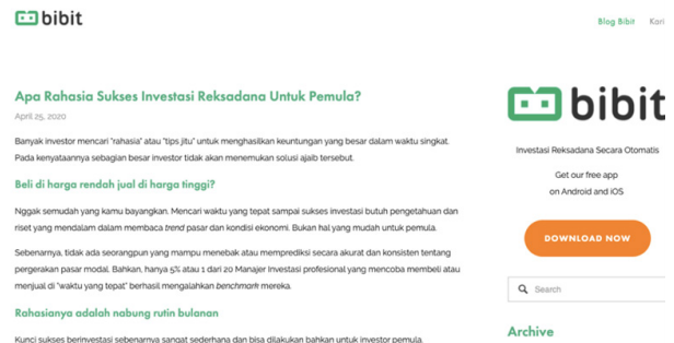
Gambar 1. Artikel Bibit.id pada 25 April 2020

Karl Marx dalam karya besarnya Das Kapital juga sempat menyingung tentang kelas dalam terbentuknya kesadaran palsu masyarakat. Doyloe (1986) mengatakan bahwa kurangnya kesadaran penuh terhadap kepentingan-kepentingan kelas dari suatu masyarakat maka penerimaan ideologi yang dikembangkan untuk mendukung kelas yang dominan dan struktur yang telah ada menurut Doyle juga akan menimbulkan kesadaran palsu. Hal tersebut serupa dengan apa yang dilakukan oleh PT Bibit Tumbuh Bersama. Dengan mengkooptasi kelas proletar (kelas pekerja) dengan iming-iming untuk lekas naik ke kelas yang lebih tinggi, Bibit menciptakan kesadaran palsu bahwa dengan investasi seseorang (dari kelas pekerja) juga bisa memiliki banyak uang layaknya kaum borjuis. Hal itu bisa dilihat beberapa unggahan artikel di blog Bibit.id pada 25 April 2020, 26 April 2020, dan 4 Mei 2020.