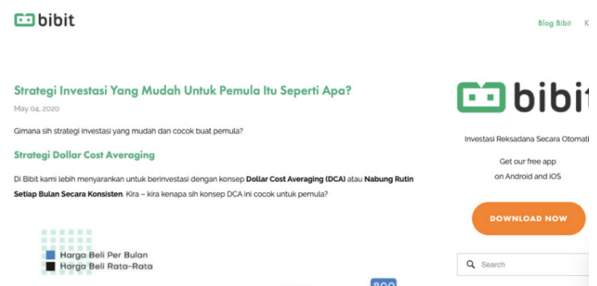
Gambar 3. Artikel Bibit.id pada 4 Mei 2020

Dari tiga artikel tersebut, Bibit seolah menawarkan “jalan pintas” bagi “pemula” (baca: kelas proletar) dalam berinvestasi. Bahkan mereka menyatakan secara berulang kali jika investasi melalui aplikasi Bibit bisa dimulai dengan Rp 100.000 saja. Angka yang tentu tidak berat di kantong kelas proletar saat ini. Ideologi ini membuat banyak kaum kelas bawah yang turut mencoba peruntungan di dunia investasi. Bahkan, peruntungan ini memunculkan ideologi konsumtif bagi masyarakat. Di mana biasanya anggaran hanya digunakan untuk beberapa keperluan, tapi dengan adanya program investasi ini, masyarakat mau tidak