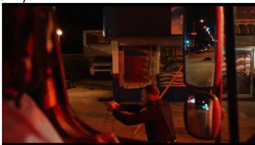
Gambar 1. Seorang polisi menembak warga sipil kulit hitam

Film Blindspotting menceritakan tentang Collin yang harus divonis karena melakukan kejahatan bersama Miles yang merupakan temannya dari semasa kecil. Collin sedang menjalani tiga hari sisa masa percobaannya yang berlangsung selama satu tahun. Namun Miles selalu masih suka berbuat onar di lingkungan sekitarnya. Pada suatu malam, Collin melihat seorang perwira polisi kulit putih menembak mati seorang pria kulit hitam. Hal tersebut selalu menghantui pikiran Collin dalam beberapa hari ke depannya.