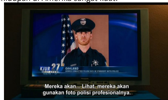
Gambar 5. Pemberitaan media tentang kasus penembakan

Nilai relasional dapat menjelaskan adegan ini bahwa antara teks dan tulisan saling terkait. Kosa kata yang tersebut berkontribusi untuk menjelaskan bagaimana kejadian yang sesungguhnya dalam kehidupan nyata (Cenderamata & Darmayanti, 2019). Bahkan sebuah foto pun tidak boleh disandingkan agar tidak terjadi pertengkaran atau konflik. Hal itu memperkuat keyakinan bahwa rasisme dalam kehidupan di Amerika sangat kuat.