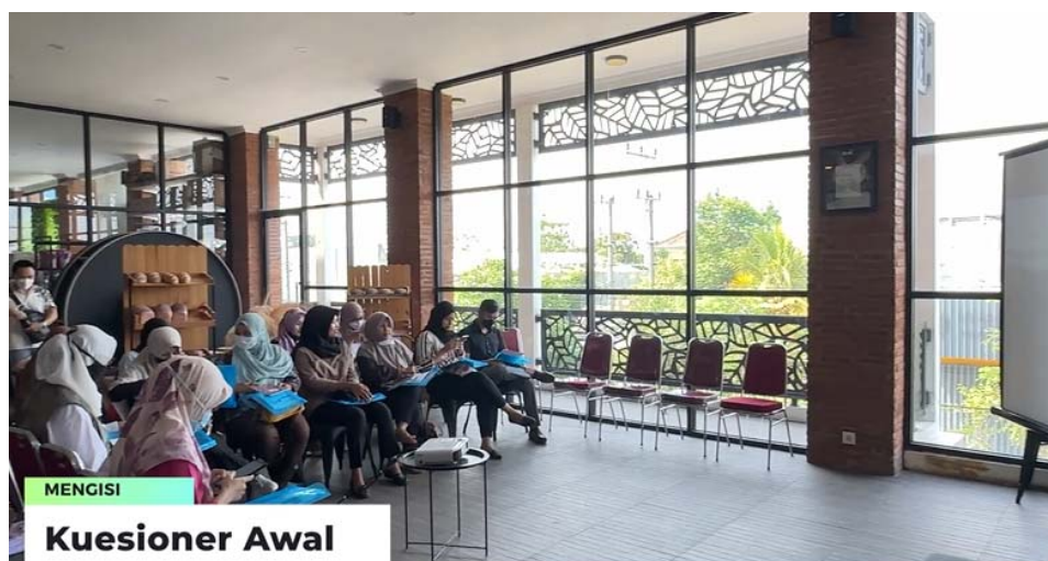
Gambar 2 Kegiatan Pengisian Kuesioner Awal