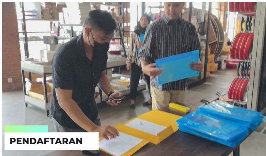
Gambar 1 Kegiatan Pendaftaran Peserta

yang berlokasi di Tulungagung. CV Torta sebagai mitra pelaksana akan menyediakan tempat untuk dilaksanakan aktivitas workshop serta menghubungkan pelaku UMKM yang bergerak dalam industri makanan dan minuman yang tergabung dalam komunitas Tobaku Torta yang merupakan mitra sasaran dalam program pelaksanaan pengabdian masyarakat ini. Terdapat 24 peserta yang merupakan pemilik UMKM makanan dan minuman yang usahanya berlokasi di Tulungagung. Dari wawancara singkat yang dilakukan dengan staf dari CV Torta Indonesia dan peserta sebelum