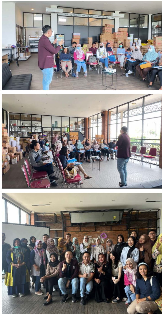
Gambar 4 Kegiatan Workshop pada tanggal 6 April 2023 di Tobaku Torta, Tulungagung

Pemahaman akan biaya tetap dan biaya variabel juga diberikan sekaligus dengan contoh yang bisa mempermudah peserta workshop dalam memahami pelatihan. Konsep titik impas atau break-even-point juga diberikan sehingga peserta bisa mengetahui bagaimana mereka bisa memastikan posisi perusahaan berada dalam kondisi