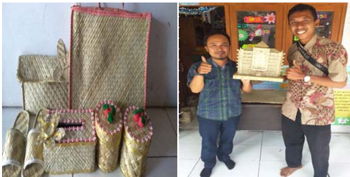
Gambar 3 Produk Hasil Pendampingan

Untuk selanjutnya perlu ada rencana pembuatan merek atau brand sebagai ciri khas produk dari Desa Ardirejo sehingga produk ini dapat menjangkau pasar yang lebih luas dan tentunya dapat meningkatkan nilai perekonomian warga.