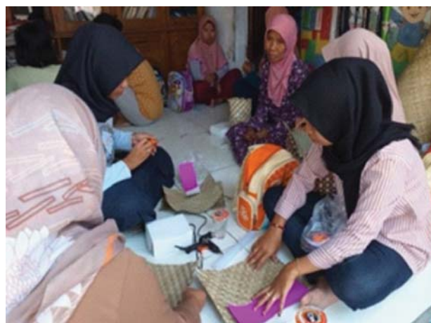
Gambar 2 Pendampingan Pembuatan Inovasi Anyaman