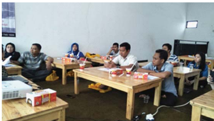
Gambar 1 Kegiatan UMKM Perumnas Kota Baru Driyorejo Gresik yang Menyatakan bahwa Materi Pertama Mengenai “ Mini Sharing Literasi Keuangan dan Perpajakan bagi Anggota Paguyuban Pengusaha Kecil di Perumnas Kota Baru Driyorejo Gresik Jawa Timur”

nai “ Mini Sharing Literasi Keuangan dan Perpajakan bagi Anggota Paguyuban Pengusaha Kecil di Perumnas Kota Baru Driyorejo Gresik Jawa Timur” sudah sangat berguna, namun mereka masih membutuhkan diskusi mengenai kondisi riil permasalahan pada bisnis masing-masing.