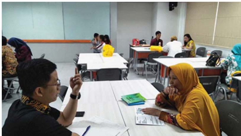
Gambar 3 Proses Konsultasi

Bukti dari hasil pelaksanaan kegiatan terlampir di bawah ini berupa gambar rekaman dari ketua paguyuban UMKM Perumnas Kota-