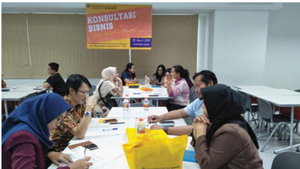
Gambar 2 Kegiatan Program Konsultasi Bisnis dan Keuangan bagi Pengusaha di Kota Baru, Driyorejo, Gresik, Jawa Timur

Hasil pelaksanaan kegiatan dilihat berdasarkan umpan balik dari para mitra yang menganggap bahwa mentoring yang dilakukan sangat berguna dan membuka wawasan para mitra. Di antaranya adalah umpan balik dari salah satu mitra yang memiliki bisnis penjualan tanaman dengan nama “TRUBUS DRIYOREJO” yang menyatakan bahwa beliau mulai aktif berjualan online dan mengalami peningkatan positif terhadap bisnisnya. Termasuk juga dengan beberapa mitra yang lain.