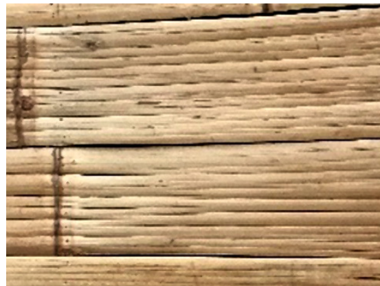
Gambar 13. Penggunaan Olahan Bambu pada Elemen Lantai di Rooftop Coffee Dago

Pada elemen lantai, terdapat beberapa variasi pengolahan material bambu yang umum diterapkan dalam konstruksi bangunan, di antaranya sebagai berikut: