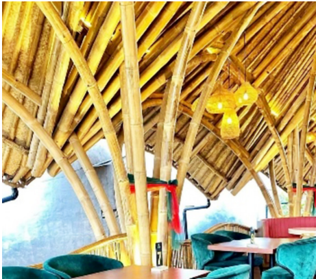
Gambar 1. Penggunaan Bambu Gombang pada Olahan Bambu pada Kolom di Kabayan 91

bambu gombang sebagai struktur sekunder. Pemilihan jenis bambu betung sebagai struktur utama dikarenakan karakteristiknya yang lebih kuat dibandingkan dengan jenis bambu yang lainnya sehingga bangunan bisa kokoh berdiri. Sedangkan untuk bambu gombang digunakan sebagai struktur sekunder karena diameternya yang cukup besar namun lapisan kulitnya yang tipis dan memiliki jarak antar ruas yang panjang sehingga kurang kuat jika dijadikan struktur utama.