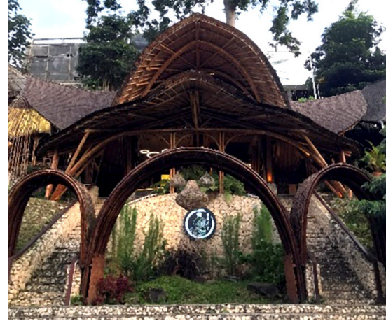
Gambar 4. Penggunaan Olahan Bambu pada Rangka Atap di Rooftop Coffee Dago