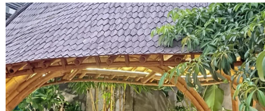
Gambar 5. Penggunaan Olahan Bambu pada Elemen Penutup Atap di Kabayan 91