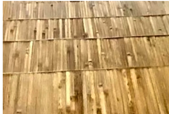
Gambar 12. Penggunaan Olahan Bambu pada Elemen Lantai di Kabayan 91