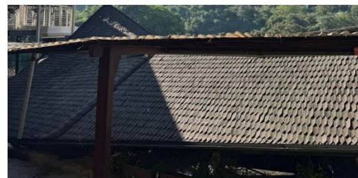
Gambar 6. Penggunaan Olahan Bambu pada Elemen Penutup Atap di Rooftop Coffee Dago

Pada bangunan Rooftop Coffee Dago dan Kabayan 91 menggunakan jenis olahan penutup atap sirap (kayu ulin). Selain olahan tersebut terdapat 3 jenis