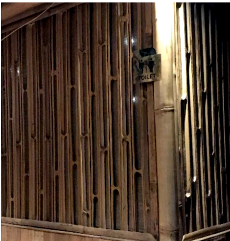
Gambar 8. Penggunaan Varian Olahan Bambu Partisi pada Elemen Dinding di Rooftop Coffee Dago