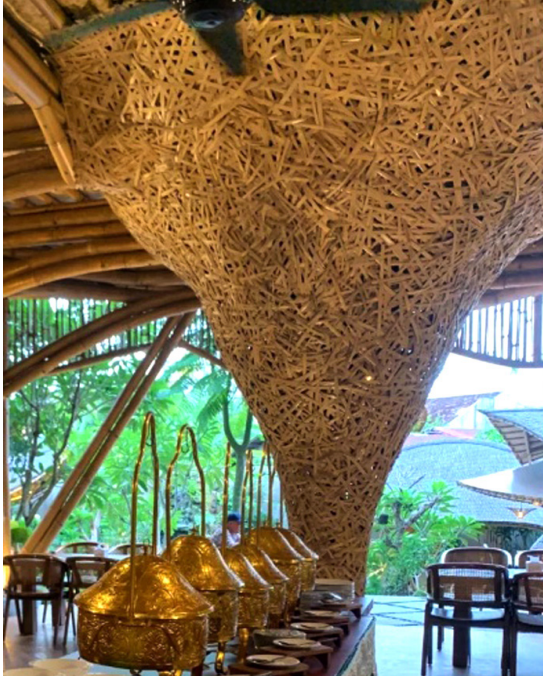
Gambar 10. Penggunaan Varian Olahan Bambu Sarang Burung pada Elemen Dinding di Kabayan 91