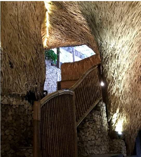
Gambar 11. Penggunaan Varian Olahan Bambu Sarang Burung pada Elemen Dinding di Rooftop Coffee Dago