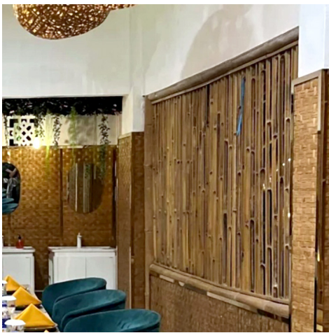
Gambar 7. Penggunaan Varian Olahan Bambu Partisi pada Elemen Dinding di Kabayan 91