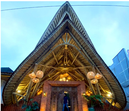
Gambar 3. Penggunaan Olahan Bambu pada Rangka Atap di Kabayan 91

Metode menggunakan bilahan bambu pipih yang ditumpuk beberapa lapis (4–5 lapis) kemudian dibaut menjadi satu, membentuk elemen yang kuat namun tetap fleksibel.