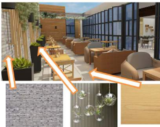
Gambar 4. Gambar Area Makan Outdoor dan Penggunaan Materialnya

itu pembatas antar ruang makan indoor dan outdoor menggunakan jendela pintu pivot yang bermaterial kaca, sehingga jendela pintu dapat dibuka maupun ditutup sesuai dengan keinginan pengunjung dan cuaca. Selain itu di area outdoor juga terdapat vegetasi tanaman rambat yang diletakkan pada dinding yang bermaterial bata abu. Vegetasi tanaman juga diletakkan di vas besar yang diletakkan di antara furnitur sebagai aksent. Penggunaan material batu koral putih diletakkan di area lantai pada area outdoor .