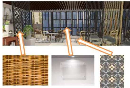
Gambar 3. Gambar Area Tunggu dan Penggunaan Materialnya

dengan tidak banyak menggunakan motif tekstur yang terlalu rumit. Penyatuan gaya modern dengan ciri khas Indonesia dapat terlihat dari penggunaan material dan warna rotan yaitu coklat, pada area ini. Selain itu, penggunaan motif batik kawung di dinding sebagai partisi dengan material rotan dan motif batik kawung pada lantai yang bermaterial tegel juga merupakan ciri khas dari Indonesia.