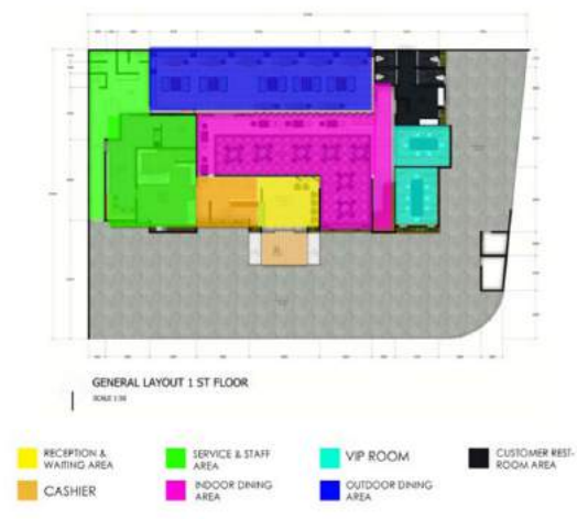
Gambar 1. Gambar Pembagian Area Lantai 1

Pada gambar 1 dapat dilihat pembagian area pada setiap ruangan yang ada di lantai satu. Peletakkan antar area pada lantai satu ini juga didasari oleh urutan kegiatan untuk melayani pengunjung yang dilakukan di dalam restoran ini.