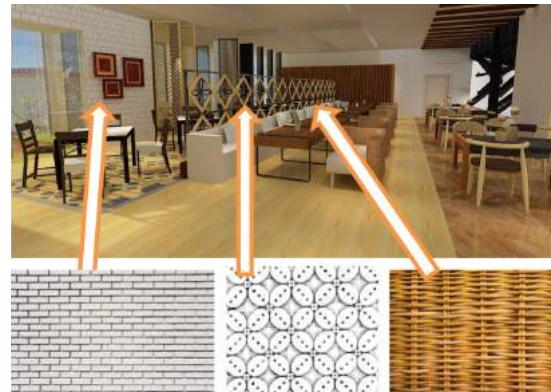
Gambar 5. Gambar Area Makan Indoor Lantai 2 dan Penggunaan Materialnya

Penggunaan material bata putih yang diidentifikasi sebagai ciri khas Indonesia juga diletakkan di lantai dua area makan indoor . Penggunaan ulang motif batik kawung yang bermaterial rotan coklat dan hitam sebagai dinding pembatas seperti pada lantai satu, juga digunakan pada lantai dua, diletakkan sebagai dinding pembatas antar area makan.