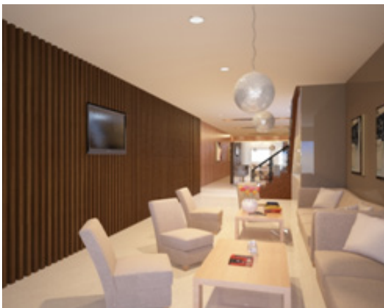
Gambar 1. Waiting Area

Karakteristik gaya yang diinginkan oleh client adalah tipe minimalist , dan berdasarkan survey lisan yang dilakukan maka dihasilkan 30% pengunjung memilih minimalist style untuk salon.