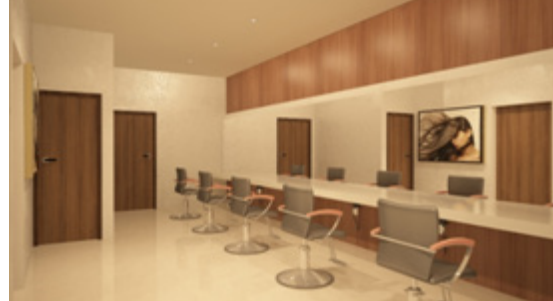
Gambar 4. Creambath Area