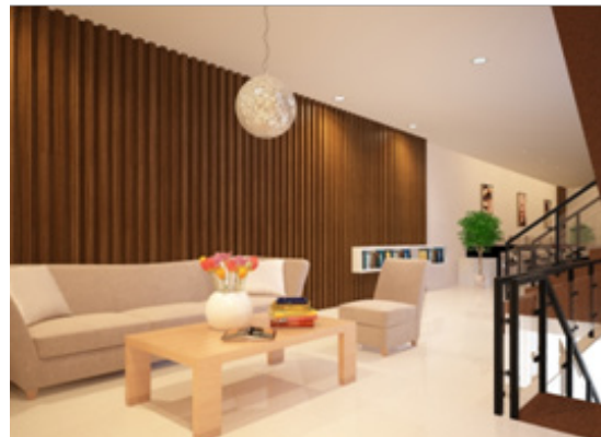
Gambar 2. Waiting Area

Sehingga pada perancangan ini, akan menggunakan minimalist style dengan campuran natural color scheme untuk memberikan warm dan nyaman terhadap pengunjung.