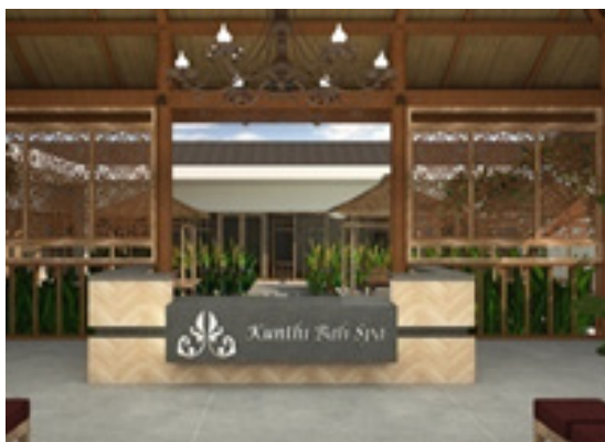
Gambar 1. Lobby Kunthi Bali Spa

Berikut terlampir beberapa gambar tiga dimensi (3D) yang berguna untuk menunjukkan hasil aplikasi konsep yang terdiri dari konsep zoning , organisasi ruang, karakter gaya, karakter suasana ruang, bentuk dan bahan pelengkap, furniture dan aksesoris pendukung interior serta