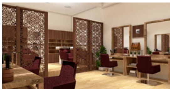
Gambar 5. Salon Kunthi Bali Spa