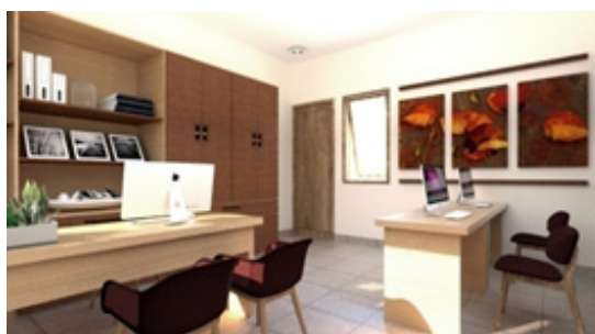
Gambar 3. Office Kunthi Bali Spa