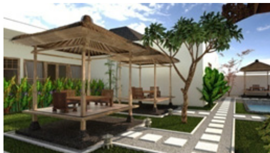
Gambar 2. Landscape Kunthi Bali Spa