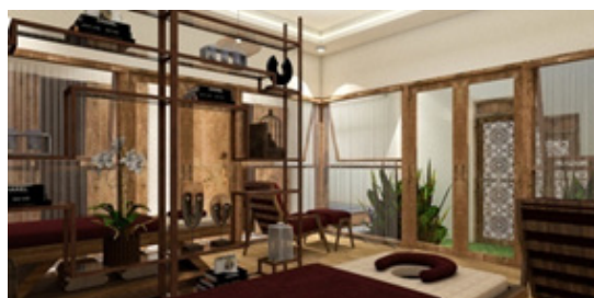
Gambar 4. Spa Kunthi Bali Spa