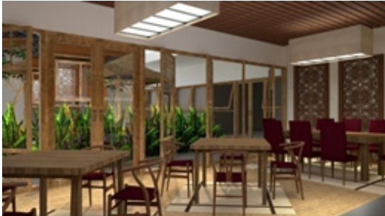
Gambar 6. Restaurant Kunthi Bali Spa