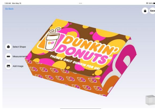
Gambar 3. Tampilan Hasil Bangun Ruang Yang Sudah Disesuaikan

Dari Gambar 2 dan 3 dapat dilihat hasil dari aplikasi yang sudah dibuat dan fungsi dari aplikasi terlihat sudah sesuai dengan tujuan dari penelitian ini yaitu membuat preview dari desain kemasan produk dalam bentuk mockup .