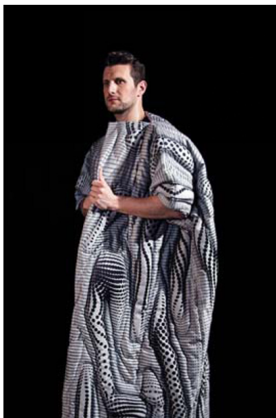
Gambar 1 CHBL Jammer Coat

Baju ini bisa membuat pengguna tidak bisa dilacak dari perangkat modern. Jadi, dengan jaket ini, kita tidak akan bisa menerima telpon, tetapi kartu penting seperti kartu kredit kita juga tidak akan bisa dilacak.