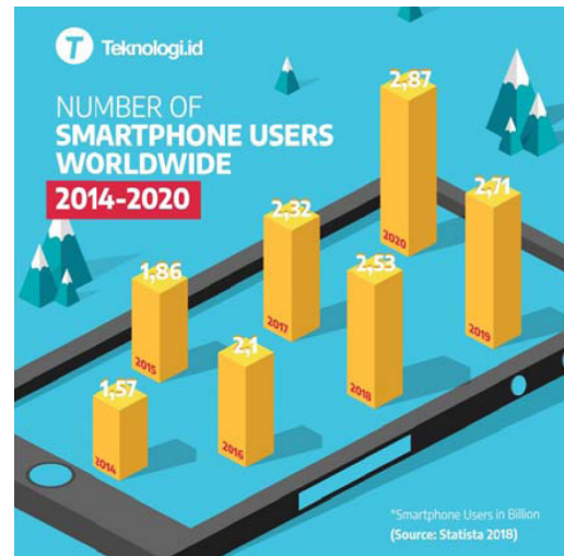
Gambar 10 Data pengguna Smartphone

kan sistem ecofriendly. Berikut adalah statistik pengguna gadget secara khusus hp selama beberapa tahun terakhir.