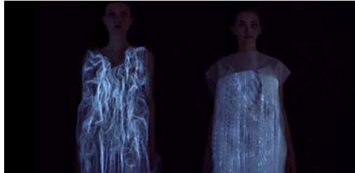
Gambar 3 Gaze Activated Dress Glow In The dark