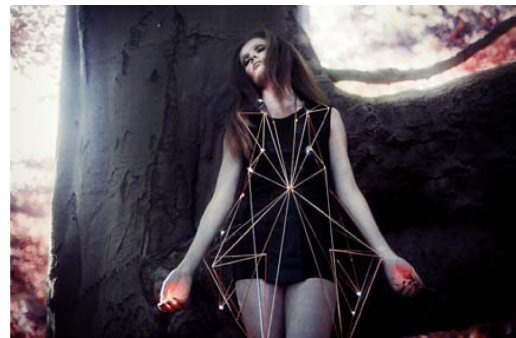
Gambar 6 Holy Dress

sentakan listrik. Karena, baju ini memiliki sistem pengenalan suara, yang akan mendeteksi saat kita berbicara, dan punya kecenderungan untuk berbohong.