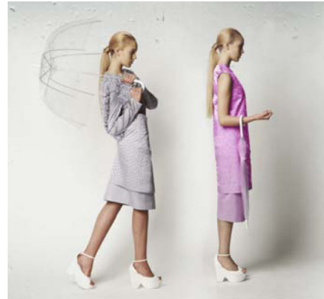
Gambar 2 Rain Palette Dress

Baju ini terinspirasi karena hujan asam sekarang adalah ancaman. Baju ini berfungsi sebagai indikator dari PH saat hujan membasahi baju. Mereka juga bahkan membuat aplikasi yang dimana orang bisa memindai warna dari baju tersebut dan mengunggah ke basis data tentang awan.