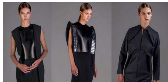
Gambar 8 Solar Power Dress

Merancang sesuatu dengan basis teknologi, fungsional, dan bisa digunakan memang bukan yang mudah. Tetapi, Tim Van Dongen menjelaskan bahwa kedua bagian ini hanyalah prototipe, tetapi dengan mengingat teknologi yang tepat dan investasi yang tepat, ia mengatakan bahwa solar dress yang bisa digunakan akan dijual seperti barang lain yang kita miliki di lemari.