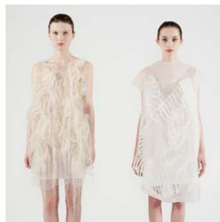
Gambar 4 Gaze Activated Dress

Gaun ini tahu kapan Anda melihatnya. Tertanam dengan teknologi eye-tracking, gaun itu menanggapi tatapan manusia. Menatap gaun itu mengaktifkan motor kecil yang menggerakkan bagian-bagian tertentu dari itu. Salah satu gaun ditutupi sulur-sulur benang foto-luminescent yang menjuntai dari kain rucked sementara yang lainnya terbuat dari benang glow-in-the-dark yang membentuk lapisan dasar