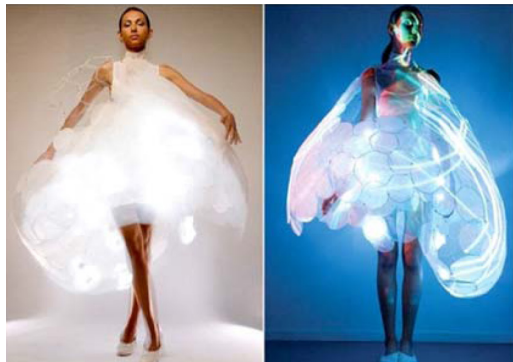
Gambar 5 Bubelle Emotion Sensing Dress

Prototipe dari Philips Design ini memberi kita pandangan ke masa depan mode di mana pakaian tidak hanya untuk melindungi, tetapi juga mencerminkan emosi kita menjadikannya bentuk komunikasi yang maju. Lapisan pertama gaun itu mengandung sensor biometrik yang memproyeksikan emosi yang datang dalam bentuk cahaya warna-warni ke lapisan kedua, tekstil luar.