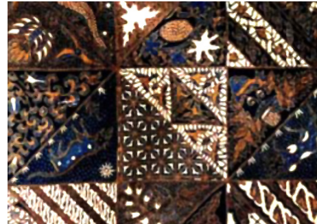
Gambar 4. Batik Motif Tambal , diakses dari https://images.app.goo.gl/7n1HkWxKtpZKDFCF9