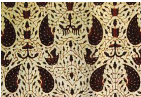
Gambar 3. Batik Motif Sido Asih