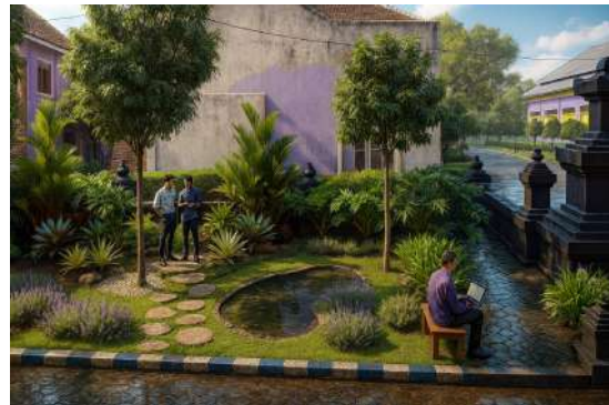
Gambar 6. Desain Zona C(b)