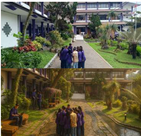
Gambar 5. Desain Zona B