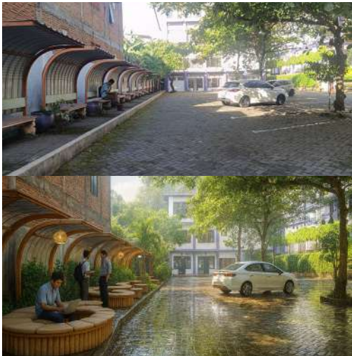
Gambar 7. Desain Zona D Sumber : Analisa pribadi, 2025

jalur sinar matahari alami, pohon kecil dengan pencahayaan sorot malam, 5) Lighting gantung hias, dan Wi-Fi hidden spot untuk mendukung interaksi digital.