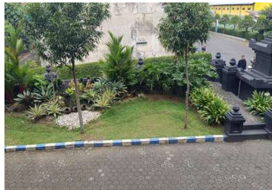
Gambar 6. Desain Zona C(a) Sumber : Analisa pribadi, 2025