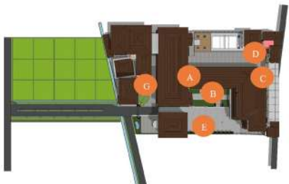
Gambar 2. Zonasi titik kecemasan

Hasil observasi menunjukkan bahwa (1) Lanskap kampus saat ini belum memfasilitasi pengalaman biofilik yang memadai. (2) Mahasiswa beraktivitas di ruang luar yang cenderung fungsional, bukan untuk relaksasi atau pemulihan stres.