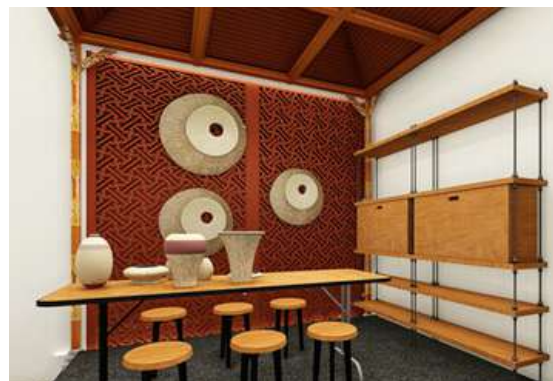
Gambar 10. Area Mini Galeri Budaya

Bali juga terkenal dengan kerajinan anyaman, awalnya dibuat sebagai kegiatan untuk memenuhi keperluan sehari-hari orang Bali. Biasanya orang Bali membutuhkannya untuk upacara adat, keagamaan, dan kebutuhan harian seperti alas duduk. Kegiatan menganyam merupakan keraji-