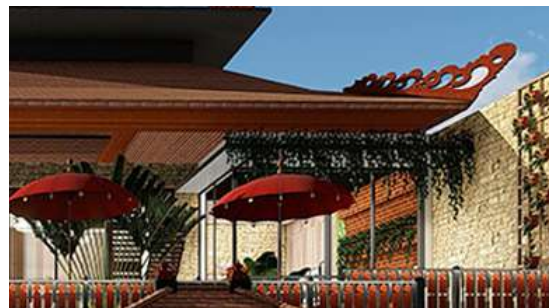
Gambar 13. Dinding Area Makan Outdoor