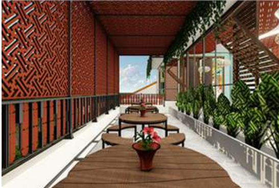
Gambar 6. Natural lighting Area makan outdoor