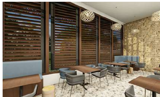
Gambar 5. Lighting Area Makan Smoking