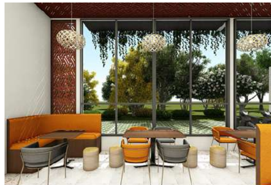
Gambar 4. Lighting Area Indoor Restoran

Pada area makan indoor penggunaan natural light dengan direct lighting sehingga menghemat energi dan biaya. Untuk area makan outdoor memaksimalkan natural lighting dan decorative lamp yang digantung. Pemanfaatan cahaya alami dengan pengaplikasian skylight mengelilingi area makan outdoor lantai 2 sehingga pencahayaan lebih merata. Area office membutuhkan cahaya terfokus menggunakan warna cool white dan pendant lamp .