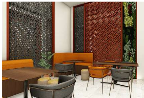
Gambar 12. Dinding Area Makan

yang saling berhubungan dari area garden lantai 1 dan lantai 2. Dinding area office dan area kerja pegawai dibuat lebih fungsional dan lebih efektif dengan cara mencat dinding menggunakan warna putih sehingga teresan lebih bersih sehingga dapat bekerja lebih fokus dan cepat. Penggunaan panel kayu solid natural.