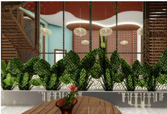
Gambar 16. Plafon Area Makan LT.2

Lantai, Lantai eksisting yaitu keramik ukuran 30x30cm tetap digunakan hanya sebagian saja yang diubah menjadi variasi agar tetap menyatu menjadi satu ambience yang telah direncanakan. Variasi pada lantai yaitu pada lantai keramik ek-