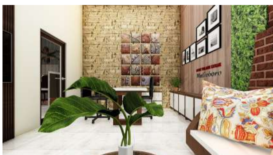
Gambar 19. Aplikasi Batik Bali pada Fabric