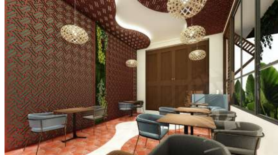
Gambar 8. Style Area Makan LT.2 Sumber: Data Pribadi, 2019

Style, perpaduan antara konsep modern dengan elemen tradisional budaya Bali yang menjadi aksen di setiap ruangan khususnya penggunaan material terracotta . Adanya area publik untuk mengedukasi masyarakat khususnya anak-anak untuk mempelajari berbagai kebudayaan Indonesia sehingga terbentuk area mini galeri dan workshop . Terracotta berhubungan erat dengan budaya dan keseharian masyarakat Indonesia, dominan digunakan untuk wadah, terutama untuk bahan makanan dan memasak. Hal ini merupakan salah satu kearifan lokal Indonesia.