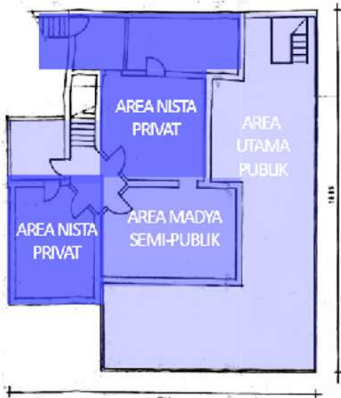
Gambar 3. Zoning Restoran Malioboro LT.2 Sumber: Analisa Pribadi, 2019