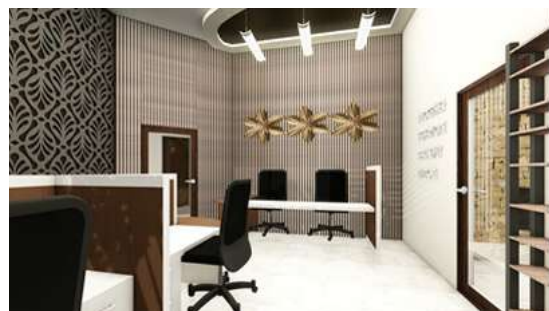
Gambar 14. Dinding Area Office