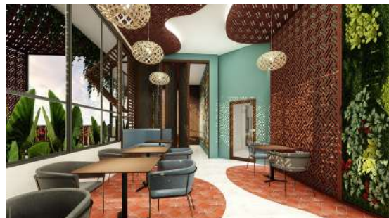
Gambar 9. Penggunaan Material Terracotta