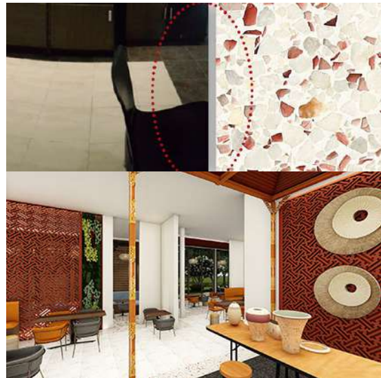
Gambar 17. Pengaplikasian Terrazzo Terracotta pada Area Makan LT.1

Lantai area makan smoking menggunakan batu alam sehingga kesan terbuka dan alami dapat tersampaikan, sedangkan area makan indoor lantai 2 menggunakan variasi antara keramik eksisting dan aksen keramik teraccotta yang pola lantainya mengikuti pola plafon pada area makan.