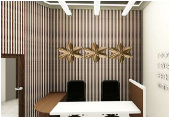
Gambar 7. Lighting Area Office

Style, perpaduan antara konsep modern dengan elemen tradisional budaya Bali yang menjadi aksen di setiap ruangan khususnya penggunaan material terracotta . Adanya area publik untuk mengedukasi masyarakat khususnya anak-anak untuk mempelajari berbagai kebudayaan Indonesia sehingga terbentuk area mini galeri dan workshop . Terracotta berhubungan erat dengan budaya dan keseharian masyarakat Indonesia, dominan digunakan untuk wadah, terutama untuk bahan makanan dan memasak. Hal ini merupakan salah satu kearifan lokal Indonesia.